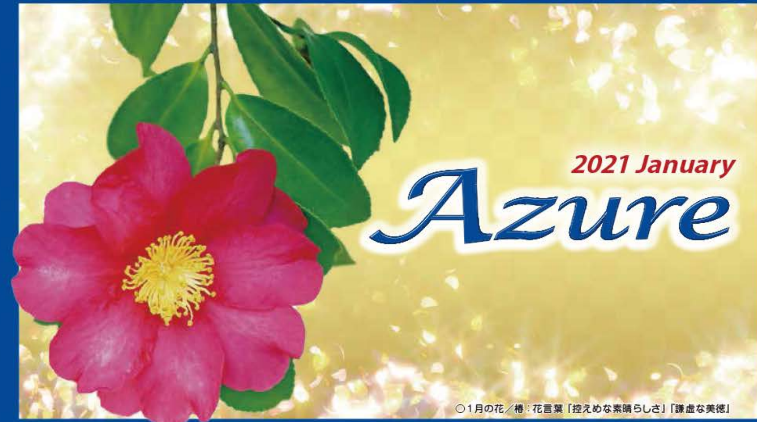
○1月の花/椿:花言葉「控えめな素晴らしさ」「謙虚な美德」

幼少の頃、優れた霊感があることを新聞に掲載される。大学在学中、米国カリフォルニアに留学し手相などを学ぶ。西洋占星術、数霊術、皇相、手相、人相、易占、風水、方位学、梅花心易、四柱推命、気学、姓名判断などが使用占術。1981年からスロの占い師として鑑定歴20年以上の実績。TV出演、雑誌掲載など多数。鑑定人数2万人以上。Webサイト監修や後輩の育成にも力を入れている。現在Oasis Counseling Roomのカウンセラーとして在籍。