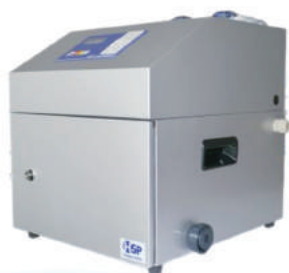
スーパー次亜水生成装置『Steri Mini』

オアシスグループでは、スーパー次亜水生成装置を設置して弱酸性次亜塩素酸水溶液を生成し、全施設・事業所で使用しています。