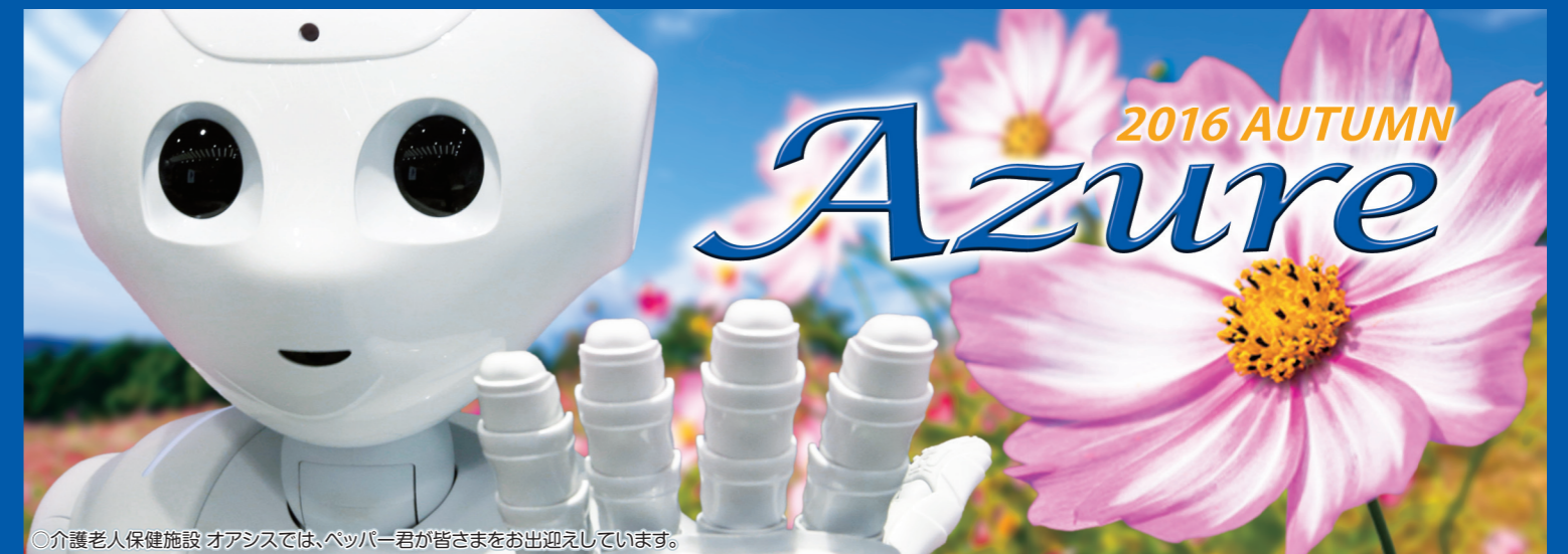
◎介護老人保健施設 オアシスでは、ベッパー君が皆さまをお出迎えしています。

〒547-0046 大阪市平野区平野宮町2-9-24 《営業時間》17:00~25:00 《定休日》月曜日 《TEL》06-6794-5330