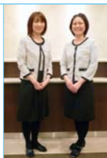
この春、受付スタッフの制服が爽やかなボーダーに変わりました! 気持ちも新たに笑顔でお迎えいたします!

この勉強会を継続することで疾患に関する知識や技術を深め、患者様に対する状態観察や言葉かけなどのサービスの質を向上し、クリニックが一体となってより細やかな対応ができるよう努めてまいります。