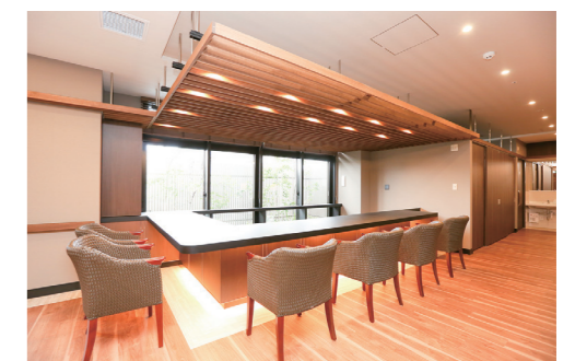
バーカウンター 光の差し込む明るい空間でお食事やお茶を楽しんでいただけます。