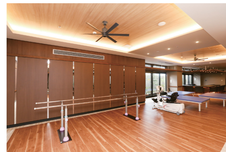
リハビリスペース 理学療法士によるリハビリが受けられます。お一人お一人の身体の状態に合わせて身体機能の維持・回復を図ります。