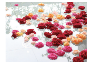
オアシス祭りの湯