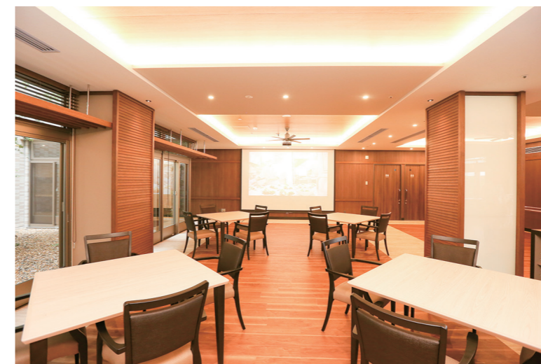
デイルーム 高い天井と広々とした解放感あふれるスペースをご用意しています。四季を彩る中庭もあり、ゆとりあるお時間をお過ごしいただけます。