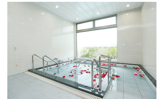
大浴場 自然に囲まれた広々とした安らぎの空間でゆったりと湯舟にお浸かりいただけます。