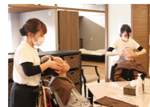
フェイシャルエステ