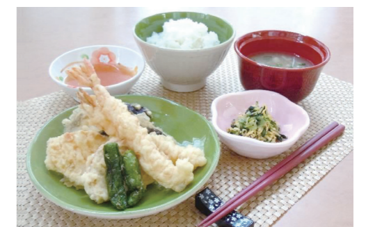
食事 管理栄養士がバランスを考慮した献立の食事を毎日ご提供いたします。