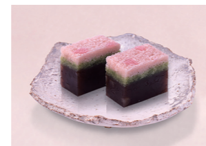
オアシス銘菓の日