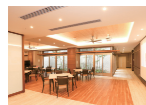
イベントスペース

また、毎月オアシスの日(7日)には全国の銘菓を味わっていただけます。オアシス祭りの湯では、バラ・檜・よもぎ・菖蒲など、毎月、季節に合わせたお風呂をお楽しみいただけます。