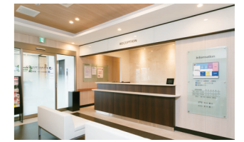
木下内科クリニック

提携医療機関（木下内科クリニック）が隣接していますので、ご入居者様の健康チェックや体調の変化にも迅速に対応します。また、認知症ケアの専門知識をもったスタッフが、24時間体制でお世話をさせていただきます。深夜でもスタッフが常駐していますので、ご家族様も安心です。