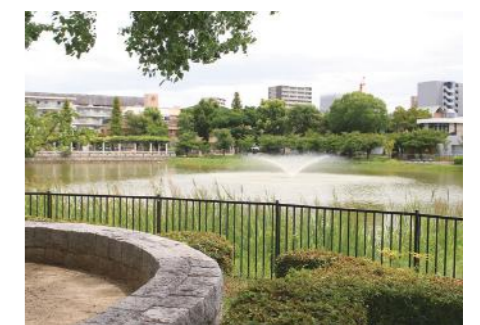
近隣施設 (万代池公園)